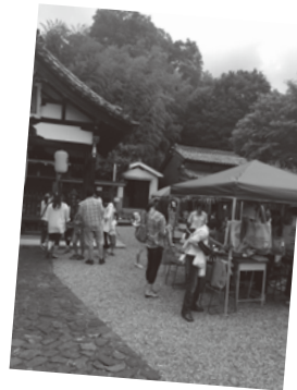
祇園社での市 (実行委員会イベント)