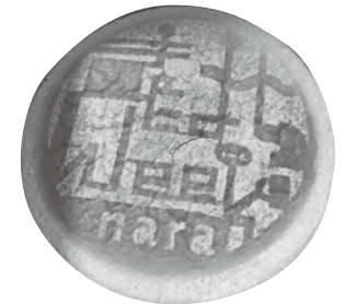
きたまち week チーズケーキ (加盟店様企画商品)